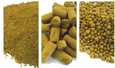
図1 リモナイトの形状

弊社ではリモナイトを粉体, ペレット, 顆粒などに成形し, 天然資源を生かした商品を取り扱っています。